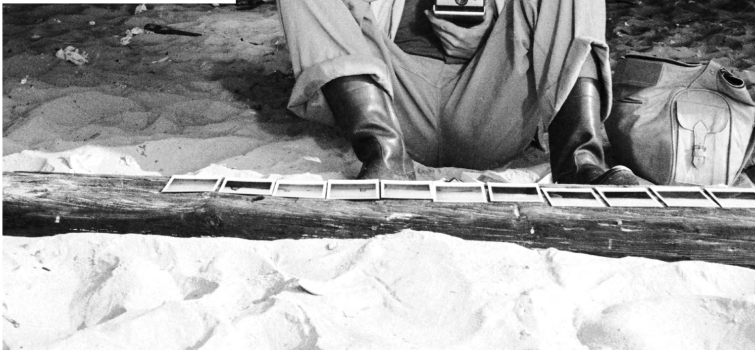
Alice dans les villes