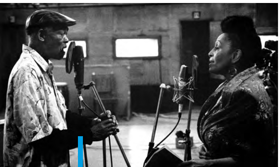
Buena vista social club