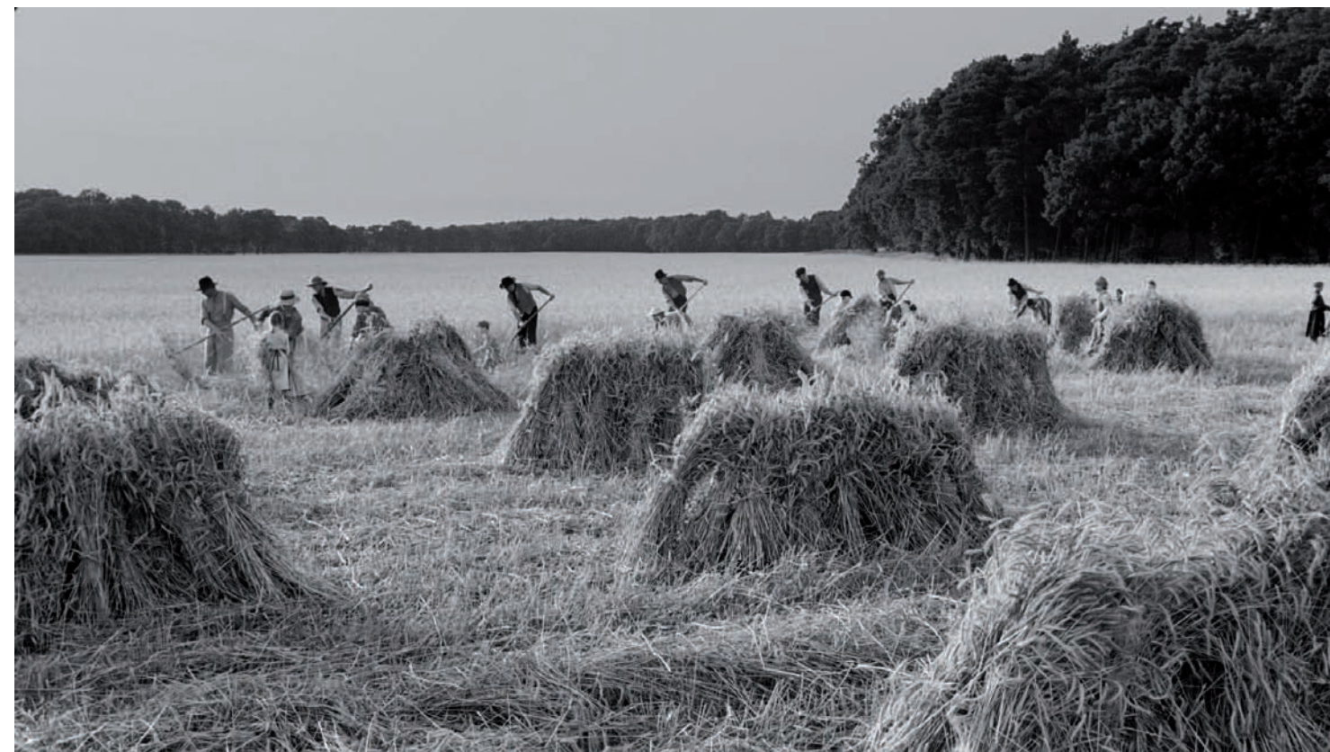
1913-1914. A la veille de la Première Guerre mondiale.