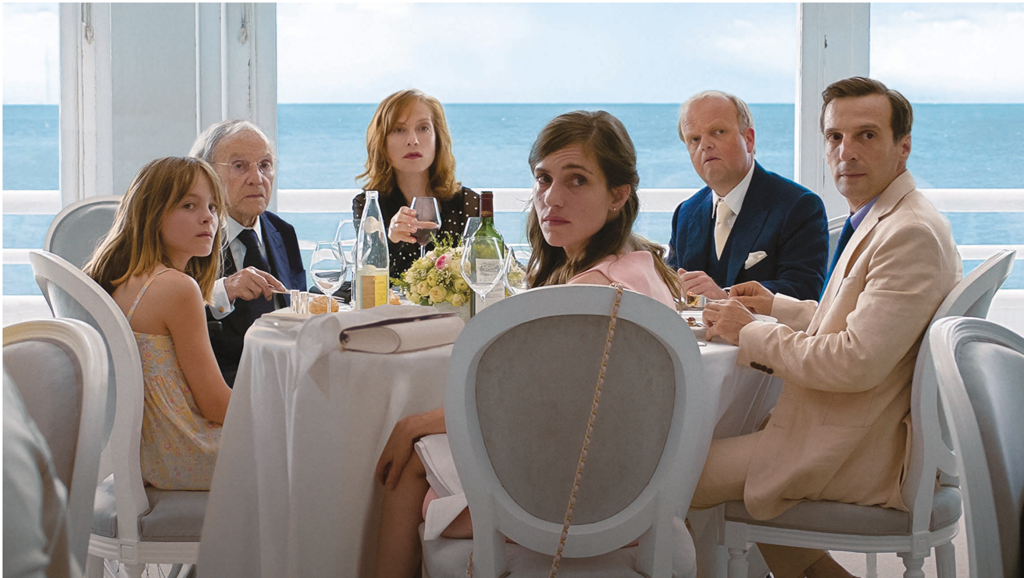
• LA FAMILLE LAURENT / THE LAURENT FAMILY / DIE FAMILIE LAURENT