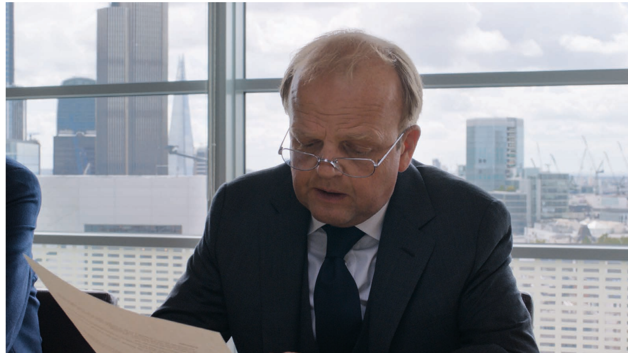
• LAWRENCE ( Le fiancé de Anne / Anne's fiancé / Der Verlobte von Anne ): TOBY JONES