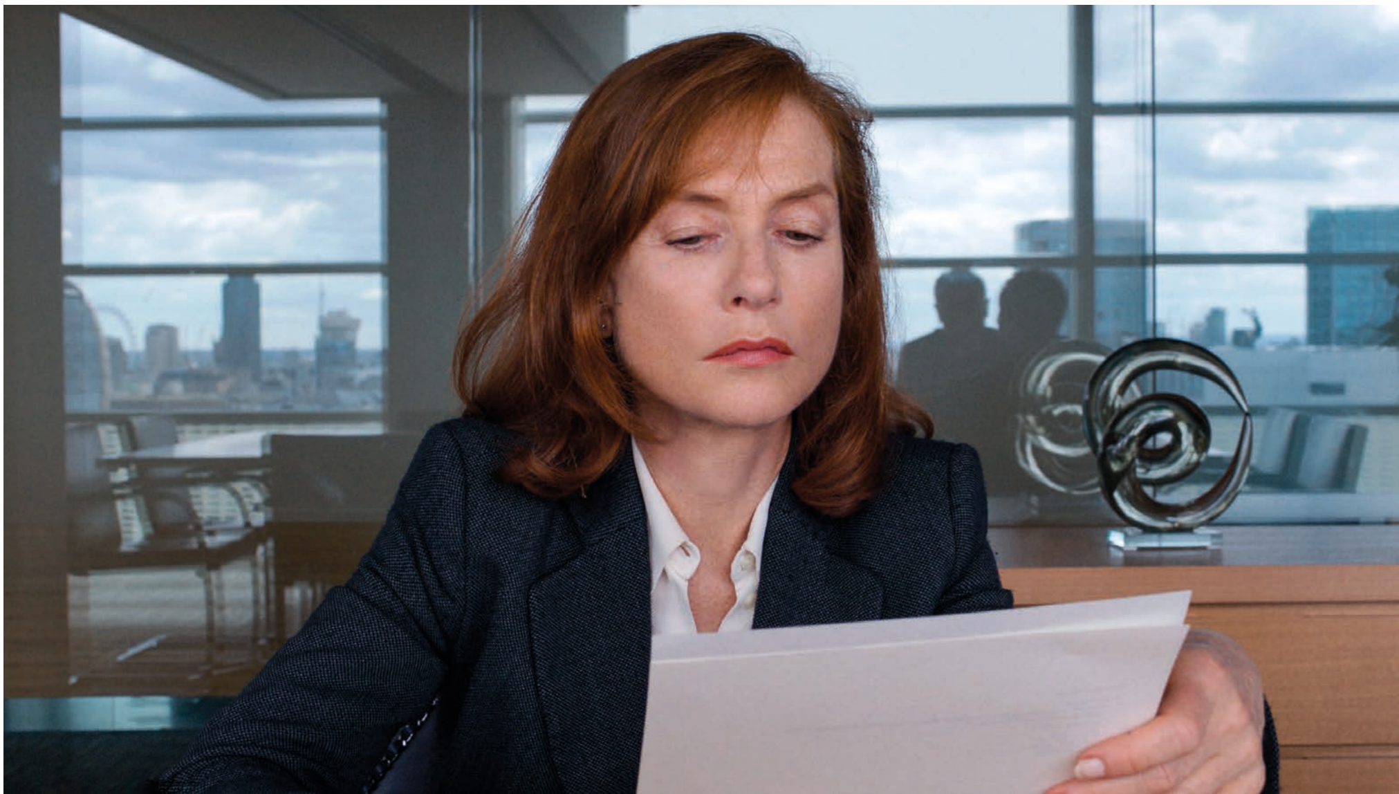
• ANNE LAURENT ( La fille de Georges / Georges's daughter / Die Tochter von Georges ) : ISABELLE HUPPERT